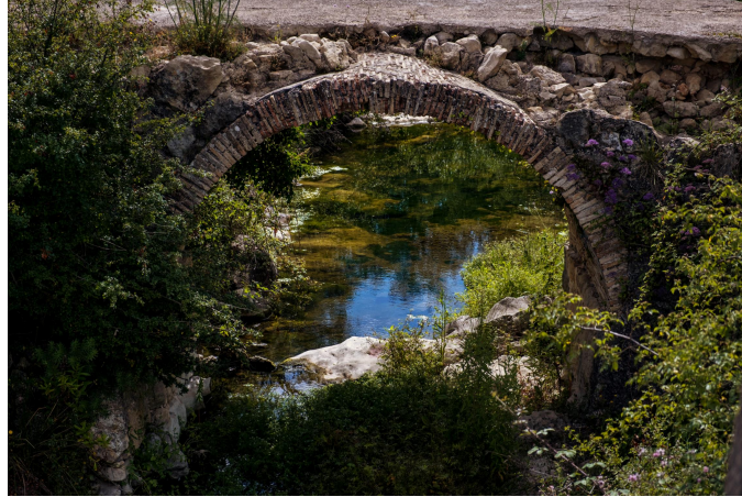
Despoblat morisc de l'Atzubieta.

declarats Béns d'Interés Cultural (BIC).