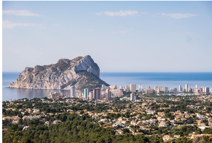
Vista de Calp.