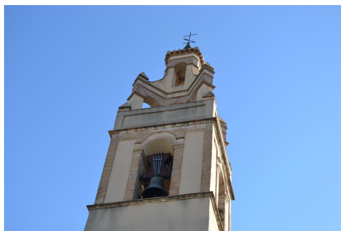
Campanar de l'església.

Recomanem tastar els embotits típics i visitar l' església de Santa Anna . El temple compta amb una façana amb rematada de motlura curvilínia. El campanar se situa en un lateral de la façana principal de l'església. És de planta quadrada i té tres cossos. El primer té una finestra tapiada, possiblement destinada a les campanes i aprofitada per a col·locar l'esfera del rellotge. Una motlura simple separa el primer del segon cos. Aquest presenta quatre finestres amb arc de mig punt i es combina el mur lluit amb la rajola vista. El tercer cos presenta dues altures amb un arc per cada lateral. El primer té uns arcs disposats en diagonal i, el segon, uns aletons i pinacles. Presenta una coberta a quatre aigües amb creu i penell.