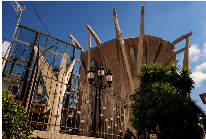
Vista de l'església.

Podem aprofitar també per a visitar aquest barri mariner. Els orígens del port es remunten al segle XV. Anirà creixent en segles posteriors fins a arribar al XIX, quan triomfa amb l'exportació de la pansa. Al voltant del port es va desenvolupar un barri amb un caràcter mariner ben marcat, amb casetes de pescadors emblanquinades de planta baixa i carrers estrets. L'encant d'aquest barri és realçat per l'escultòrica silueta de l'església de la Nostra Senyora de Loreto , inaugurada en 1967, important exemple de l'arquitectura religiosa d'avantguarda, que destaca per un disseny atrevit de les línies i la concepció de l'espai.