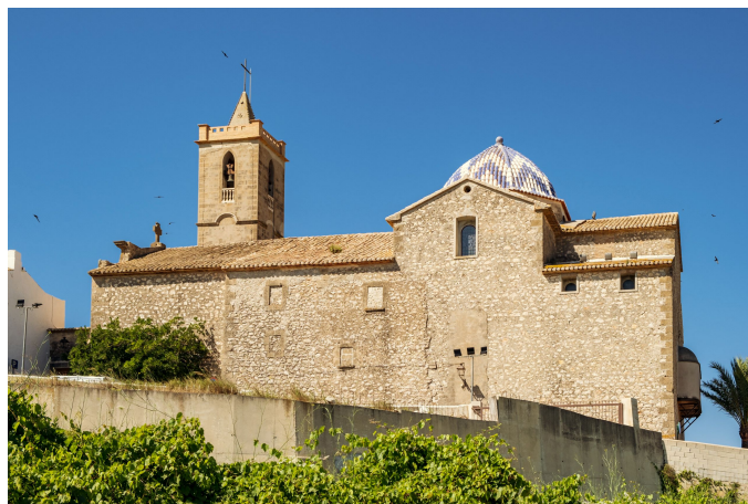
Vista de l'església.